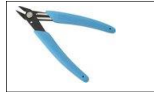
extra nodig: tangetje